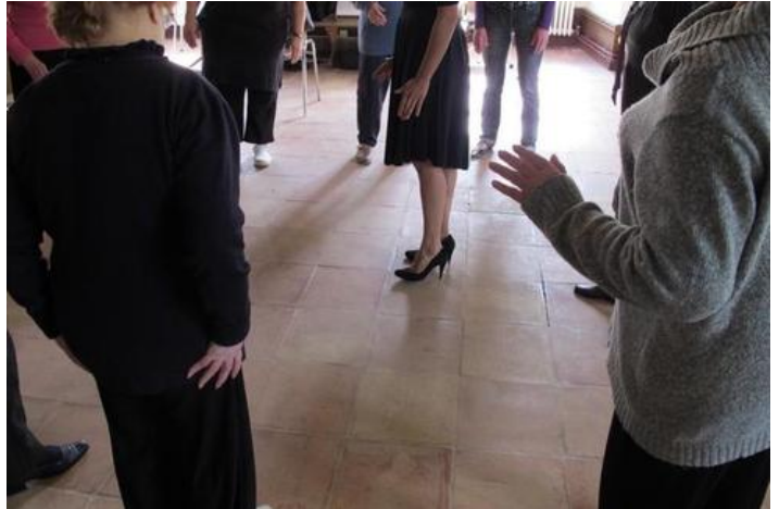
Trois pas, trois petits pas à apprendre suffisent pour danser le tango.

Tel est l'objectif de cette rencontre expérimentale, qui viendra prolonger le travail des neurophysiologistes dont les investigations dans le domaine de la musique et du cerveau ont bien avancé au cours des vingt dernières années. Et si la corrélation entre musique et lutte contre la maladie d'Alzheimer se confirme, les applications dans le monde de la santé pourraient être nombreuses dans les prochaines années.