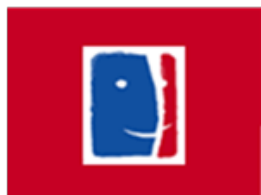
Fondation Les Gueules cassées