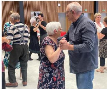
Les résidents de la Marpa de Montigny-sur-Aube ont présenté leur tango cumparsita devant le jury des Olympiades des aînés Tangueros à Dijon.